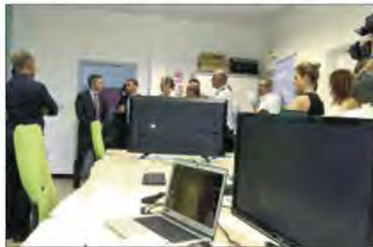
Sur 1,4 milliard d'euros de chiffre d'affaires, le numérique péi en réalise 10% à l'export.