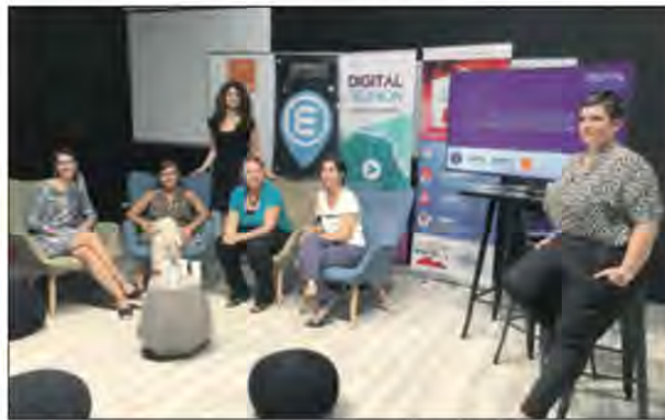
L'association Digital Réunion organisait une table ronde avec des actrices de l'innovation hier à l'école Epitech de Saint-André