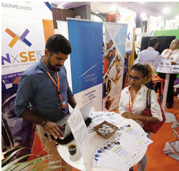
Les éditions précédentes avaient séduit les visiteurs.

Pour la filière, ce sera l'occasion de se rapprocher de ses partenaires nationaux: Syntec Numérique, Cap Digital, CIGREF, Talents du Numérique, Outremer Network, French Tech... "Nous souhaitons que cette édition exceptionnelle à Paris marque un tournant dans notre légitimité à incarner le numérique français en Afrique australe", insiste Philippe Arnaud.